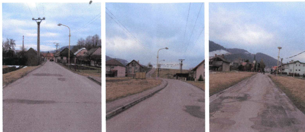
ul. Černovských martýrov