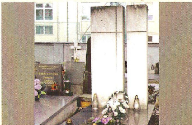
Javorkov náhrobník symbolizuje ideu zjednotenia kresťanov, ktorej zasvätil celý život.

Občianske združenie Múzeum ozbrojených zložiek 1939 – 1945