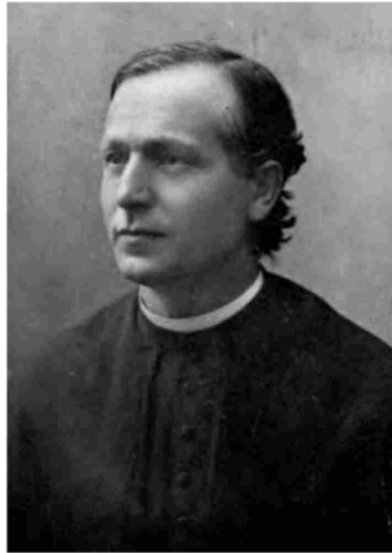
Andrej Hlinka ako mladý kňaz