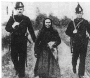
Zatýkanie žandarmi v Černej