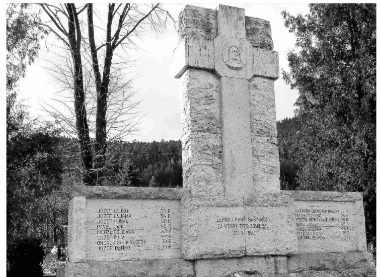
Pamätník zastreleným občanom Černovej

Toto „úradné opatrenie“ bolo jednou z najkrvavejších udalostí posledných rokov dualizmu v Rakúsko-Uhorsku a vyvolalo veľké protesty v európskej