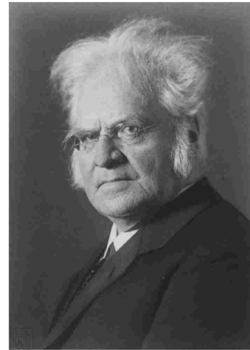
Bjørnstjerne Bjørnson, nositeľ Nobelovej ceny za literatúru

dobovej tlači. Medzi významnými osobnosťami, ktoré protestovali, bol francúzsky spisovateľ Viliam Ritter, anglický novinár a historik Robert William Seton-Watson, známy pod pseudonymom Scotus Viator, nórsky spisovateľ a nositeľ Nobelovej ceny Bjørnstjerne Bjørnson, českí poslanci rakúskeho parlamentu i predseda