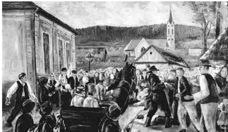
Strelba v Černej v roku 1907