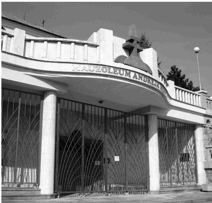
Mauzóleum Andreja Hlinku v Ružomberku

Posvätením kostola bol biskupom poverený slovenský farár z Liskovej