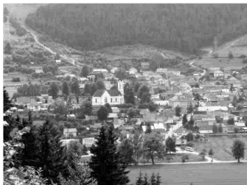
Mestská časť Ružomberka - Černová